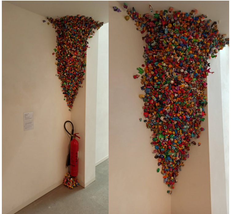
Andreas Ilg (*1966): Guter Virus (2021).